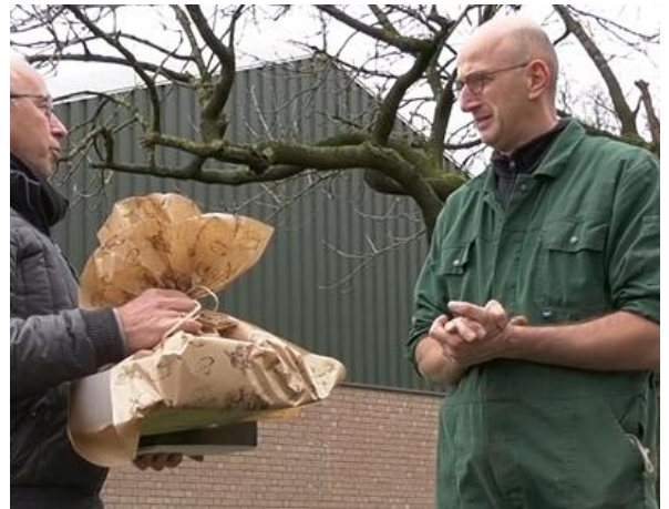
Figuur 1: vz SDK bedankt vz Zorg en Welzijn

In de corona periode, met name in het eerste jaar, is er door de commissie Zorg & Welzijn veel gedaan om de getroffen door corona een hart onder de riem te steken. Zo hebben ze kleine attenties uitgedeeld; kaartje, kaarsje, paaseitje, etc. En hebben ze samen met de dames van werkgroep Eetpunt gedurende een aantal maanden de eenzame mensen, mensen die wekelijks naar het Eetpunt Keldonk kwamen, door corona getroffen of in ander zin hiervoor op de lijst kwamen, met regelmaat even gebeld: “hoe is het” en even een praatje gemaakt. Dit deed de mensen erg veel goed. Deze acties zijn ook doorgedrongen in Meierijstad, bij onze buurtadviseur(s). En als bedankje mocht de vz van de dorpsraad, namens de gemeente Meierijstad, bij deze groep mensen een speculaas of Sint-Nicolaas presentje brengen, van onze lokale Bakker, die er een mooi pakket van had gemaakt. Het lekkernijen werden ontvangen met: “had niet hoeven” enz, maar de dank hiervoor was toch groot en als bijzonder leuk ervaren. Ook hiervan is op bovengenoemde sites meer info hierover te vinden.